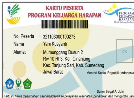
KARTU PKH LAMA (PESERTA PKH 2007 - 2011)