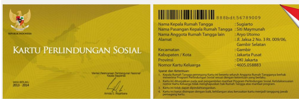
KARTU PERLINDUNGAN SOSIAL (KPS)